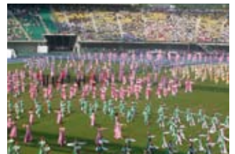
開会式式典演技の様子