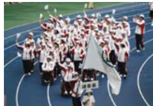
「ミナモ」の小旗を持った岐阜県選手団 入場行進

各会場は、歓迎の装飾や花飾りに囲まれ、また、ボランティアや地元大分県の方々のおもてなしや温かい心にふれて参加者同士が交流を深め、笑顔にあふれた大会となりました。