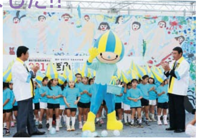
会場の声援を受けてPRキャラバンに出発する『ミナモ』

また、6月13日(金)から15日(日)までの3日間、同じく岐阜シティ・タワー43で開催した「マスコットふれあい広場」では、多くの子どもたちが『ミナモ』のぬり絵やフォトシールを体験したり、年輩の方が昭和40年岐阜国体の写真を懐かしむ姿が見られました。