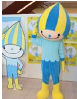
マスコットふれあい広場で国体をPRする『ミナモ』