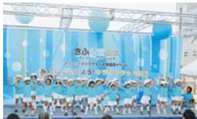
若葉第三幼稚園(岐阜市)の園児たちによる祝賀パフォーマンス